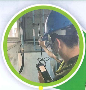
設備機房溫度檢測